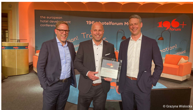
Bildunterschrift: 6 W U D K O H Q X P G L H H B W XWUJ X7QKGR P 2OV L Y