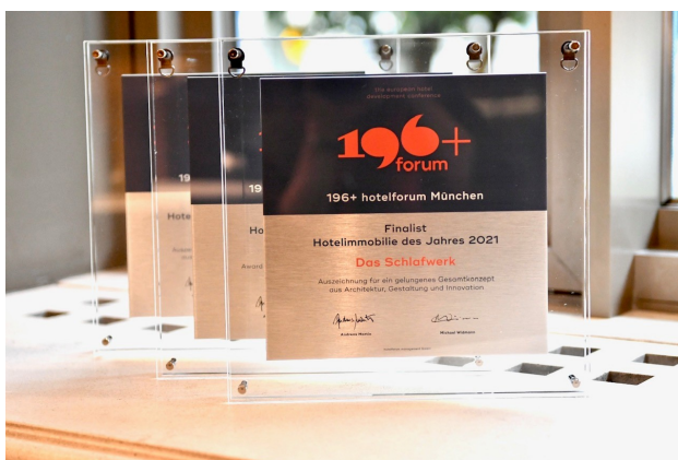
Bildunterschrift: Das Zertifikat "Finalist – Hotelimmobilie des Jahres 2021"